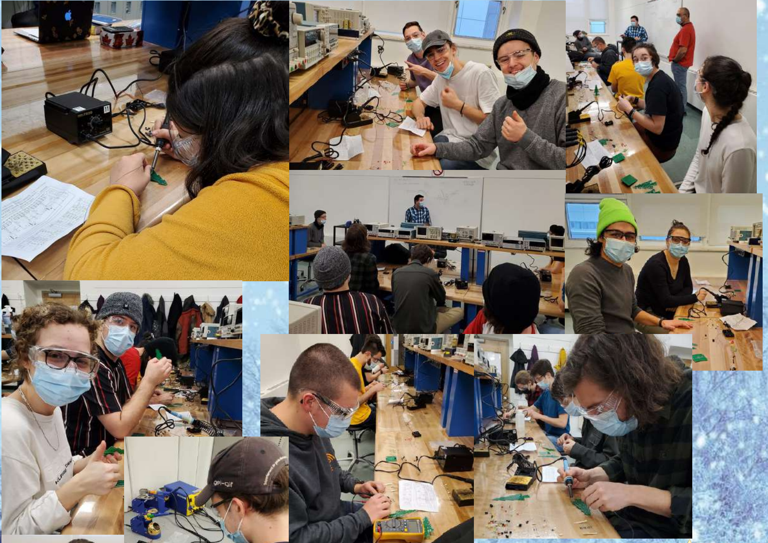
Le beau sapin de diodes

Quel beau projet ce fut! Organisée par l'IEEE, cette session de confection de sapins a été une belle réussite! Près d'une cinquantaine d'étudiants sont repartis avec un joli petit sapin qu'ils ont pris le soin de bien souder. Un beau cadeau pour célébrer la fin de la session et le début des vacances.